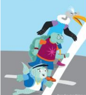
Deze Gouden Willem-pakket heeft bij kwik, een uitgave van: www.kwikopschool.nl

Go met de lippen in een ring afzet. Vertel de kinderen dat het in deze oefening gaat om samenwerking onder elkaar bij het pakken of gebaren te maken. Het gaat om concentratie en elkaar iets gunnen. Bij de mogelijke vier gaat het erom dat er altijd vier kinderen tegelijkertijd staan. Hetel meer en moet minder. Als er meer dan vier staan start het spel opnieuw. Staan er minder? Dan begint de groep ook opnieuw aan het spel. Het spel wordt enige oefening maar bij goed oefenen slagt het zeker.